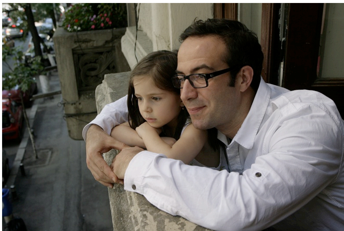
Kadr z filmu „Wszyscy w naszej rodzinie”

Radu Jude w swojej nowej czarnej komedii z humorem opowiada o mrocznych stronach życia rodzinnego. Jego film uosabia najlepsze cechy nowoczesnego rumuńskiego kina i był odkryciem sekcji Forum na tegorocznym Berlinale.